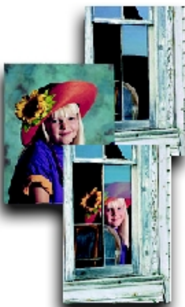
將不同相片於 Photoshop 合併

透過 Layer 製作可做出多層面的效果，亦可於每個層面的圖片加上其他設定如陰影，鬆邊等等。