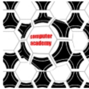
2 利用 Photoshop 的 filter 製作出激凸效果。