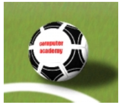
4 替足球加上陰影及底紋。